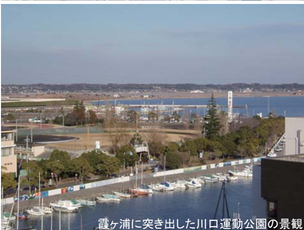
霞ヶ浦に突き出した川口運動公園の景観