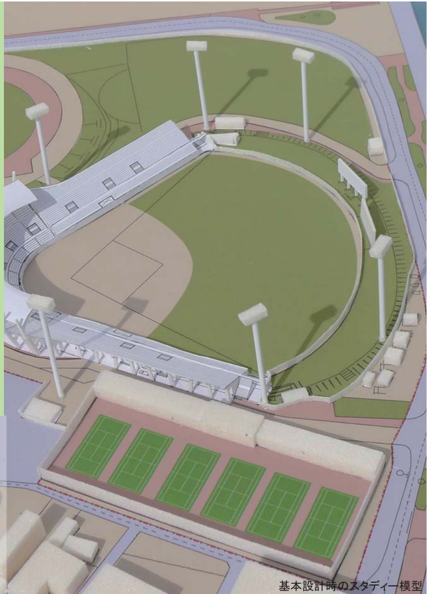
基本設計時のスタディー模型

野球をするひと、応援するひと、はたらくひと、みんなにうれしい球場へかねてより市民から要望の多かった内野観覧席を大幅に増やすとともに、ダッグアウトやブルペンなど野球関連諸室を充実させ、だれもが野球を楽しむことのできる施設をめざします。