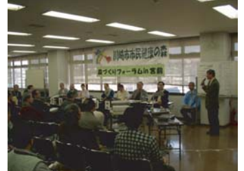
森づくりフォーラムの開催