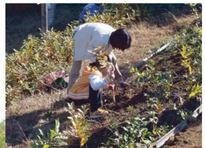
地元の小学校によるドングリ苗の移植