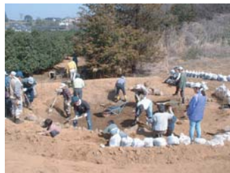
ビオトープ池を市民で整備