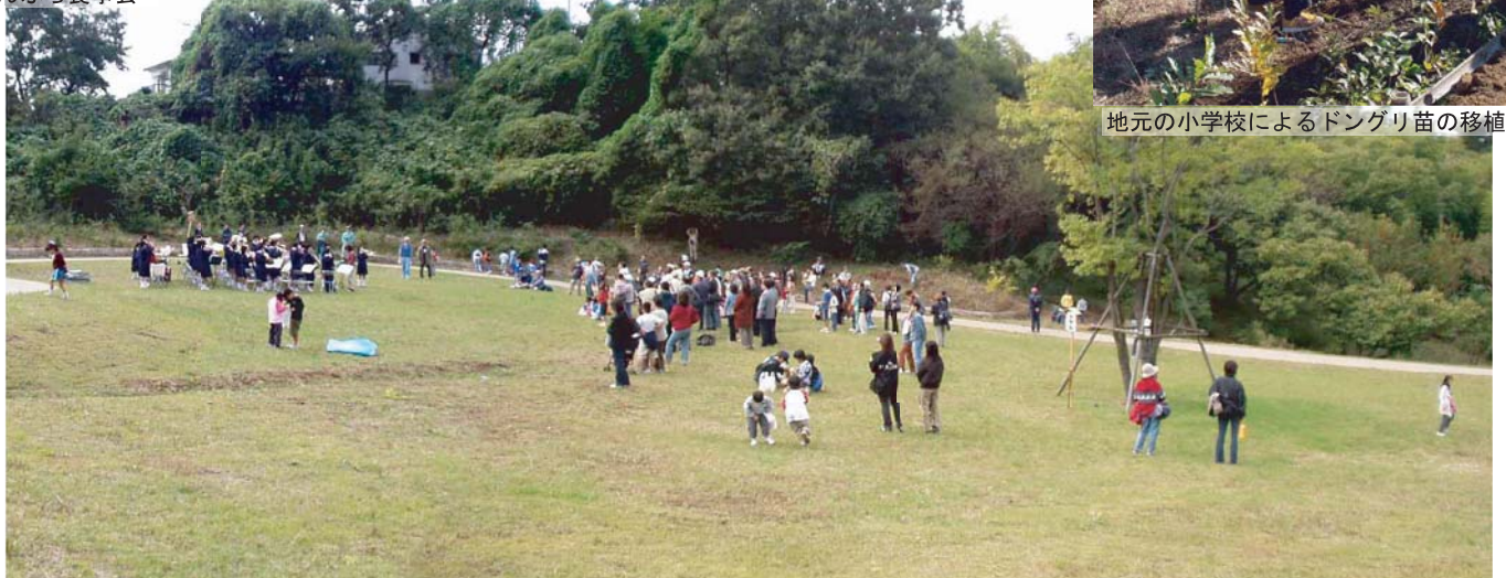
演奏会 地元の中学校バンドによるオープニングイベント