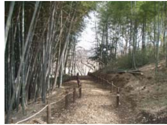
保全林内の散策路