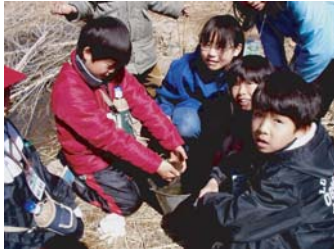
ビオトープ池で観察会

平成10年度から川崎市内の7区それぞれに「市民健康の森」を創る事業としてスタートしました。この事業は市民との協働により、計画地の選定、計画案の立案、管理運営の実施を段階的に進めるものでした。この宮前区市民健康の森「みんなの里山水沢の森」をテーマに水源地の森の保全、里山の原風景の再構築を目指しています。計画段階から里山の維持管理の試行や子供たちの環境教育のフィールドの提供・体験のサポート、育林整備などを行い計画のイメージをつくりました。平成16年には、仮オープンを迎えました。現在、緑地の維持管理を活動グループ「水沢森人の会」が進めています。また平成14年には森づくり活動の情報交換と交流を目的に「森づくりフォーラムin宮前」を開催しました。