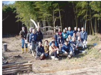
市民グループ活動の一コマ