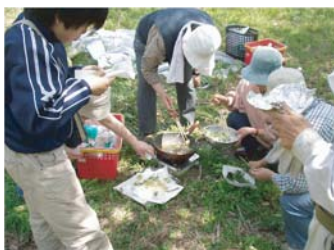
野草でてんぶら食事会