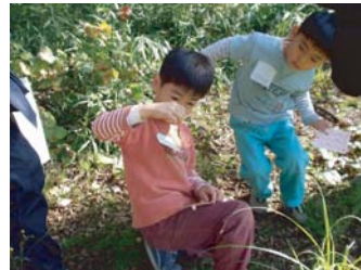
ネイチャーゲーム