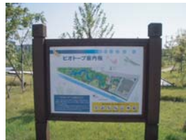
ビオトープ解説版