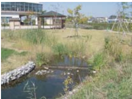
処理水を利用したせせらぎ