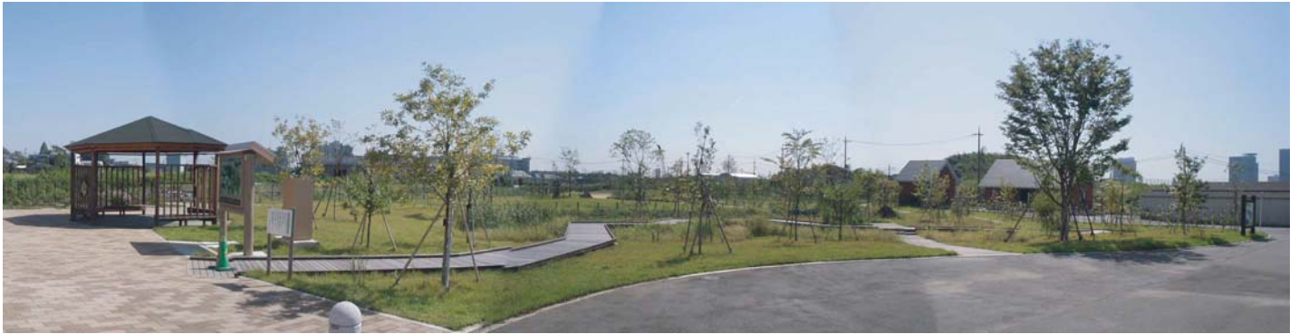
センターから全景（自然庭園の入口）