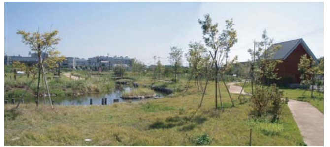
水辺の多様な環境をつくる