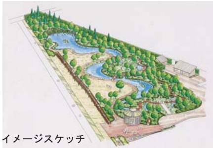
イメージスケッチ