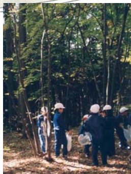
落ち葉やススキなど気に入ったものを採集する。