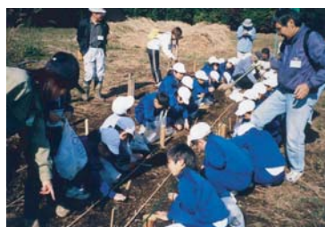
雑木の苗木を育てるために、ドングリ 完成したドングリ工場。を蒔いてドングリ工場をつくる。