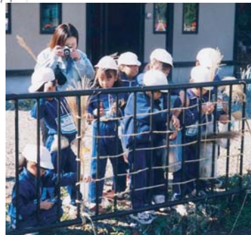
集めた材料で秋の屏風をつくってみんな集まり記念撮影。