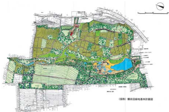
(仮称) 鶴田沼緑地基本計画図