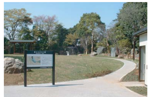
入口広場周辺。右側がトイレ。舗装は最低限の面積に留め、動線となる部分は芝生保護材で対応した。