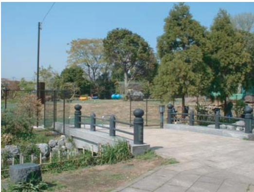
小鮎水路に架かる橋が入口のゲートがわりになっている。 橋の奥が今回整備した公園。