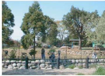
小鮎水路の対岸からみた内溜地区。