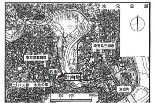
● 位置 (葛飾区東水元二丁目地内)