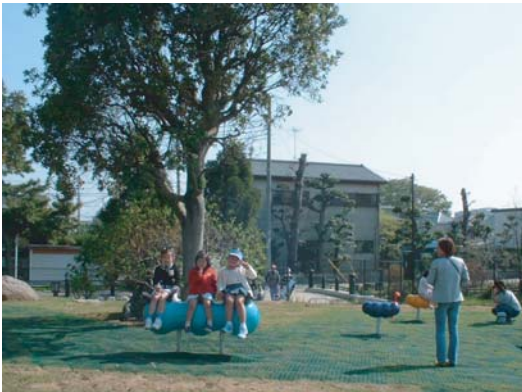
大きなヤマモモの木の下、遊具で遊ぶ子供たち。