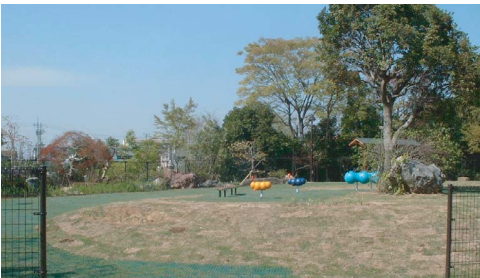
地域のイベントで利用しやすいように広場をできるかぎり大きくとり、開放的なつくりとした。 既存の庭園にあった石組みの景石もすべて敷地内で石積や景石として再利用した。