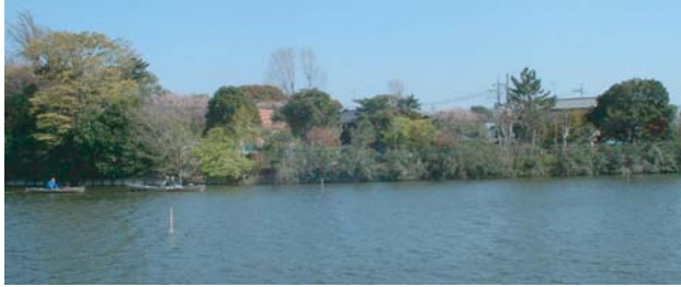
対岸からみた公園。ケヤキ、スダジイ等の大きな既存木はできるかぎりそのままの位置で残し、小さなものは移植、新植樹木は無し。

もともとは2宅地であった敷地を一体化し水元公園の飛び地として整備を行った。 水元公園本体とは違い地元との協議を行い、地域イベント利用が主体の小広場とした。